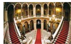
Slika 4. zgrada u Ulici kralja Petra