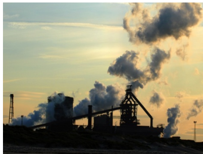
Slika 1. Preciscavanje vazduha