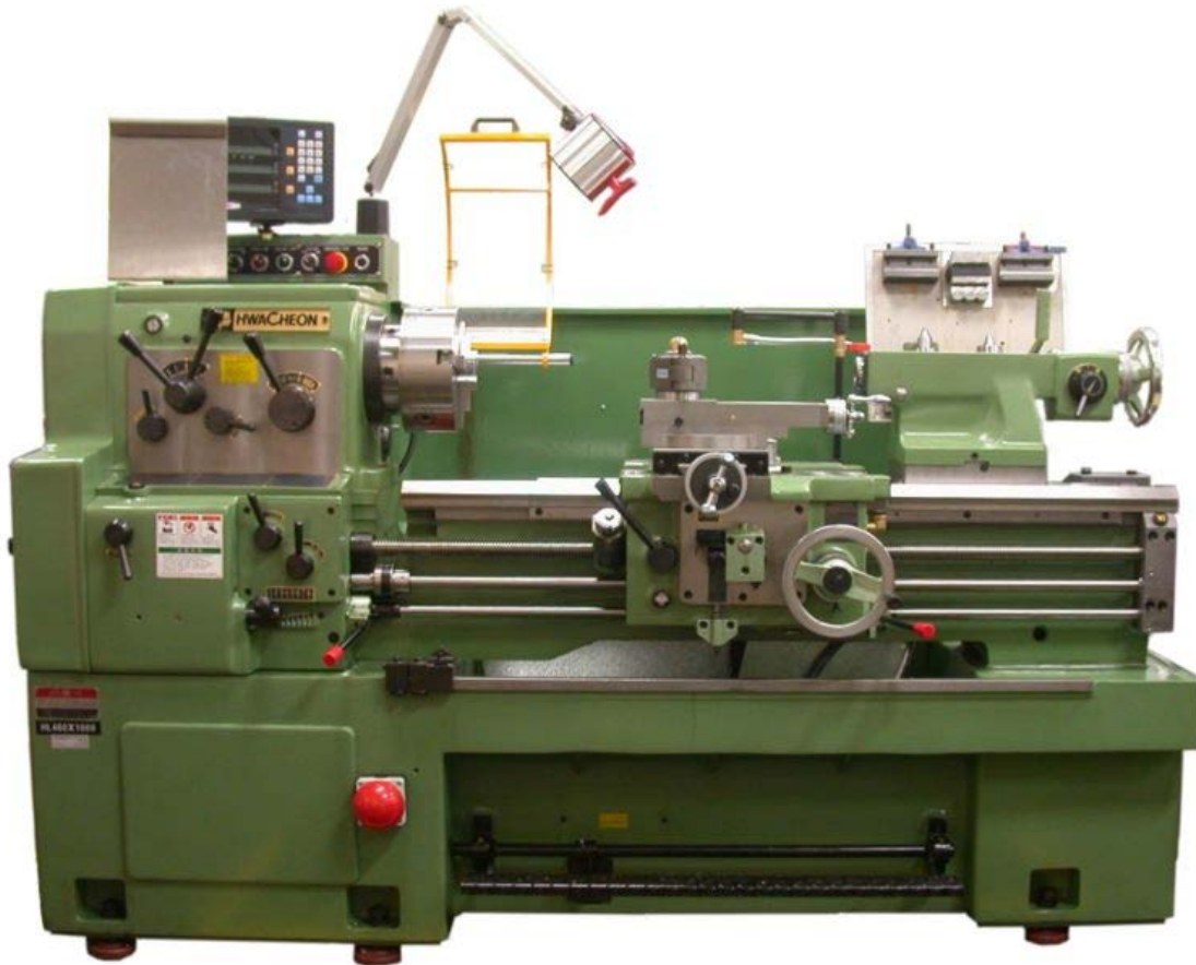
Савремени конвенционални струг(слика 1)

Бољи стругови могу имати копирајући механизам, механизам за прављење навоја, а најсавременији су програмабилни стругови (CNC, односно НУ стругови), којима је могуће у програмирати жељени облик радног предмета кога ће потом сами направити.