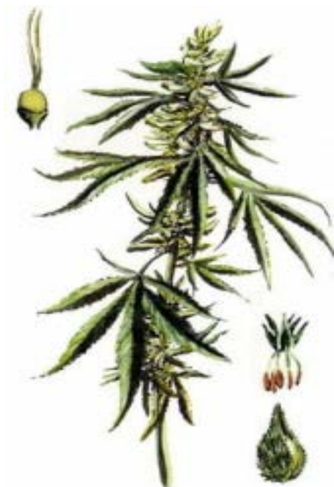
KONOPLJA [ cannabis sativa ]