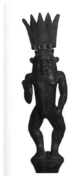
egipatski bog sna Bes

Širom sveta razni narodi neguju svoja shvatanja snova. Kroz istoriju snovi su značili različita predskazanja (iz njih su se izvodili znaci za budućnost) i njihovom tumačenju posvećivana je posebna pažnja. Za antičke narode snovi su bili božanske (ili demonske) poruke koje su sveštenici i sveti ljudi tumačili. Za Grke i druge istočne narode, neki ratni pohod bio je nemoguć bez prethodnog tumačenja snova. Poznati su grčki bog Hipnos, koji je bio brat smrti i sin noći i staro- egipatski bog sna Bes.