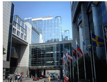
Kompleks Espace Léopold , sedište EP u Briselu

Od 1970. godine, Evropski parlament, zajedno sa Savetom, ima kontrolu nad budžetom EU , i na kraju procedure, usvaja budžet u celini. Parlament takođe vrši demokratski nadzor nad Evropskom komisijom , uključujući i pravo veta nad postavljenjem Predsednika i celokupnog sastava Komisije, kao i pravo izglasavanja nepoverenja Komisiji. EP praktikuje i politički nadzor nad svim drugim institucijama Unije.