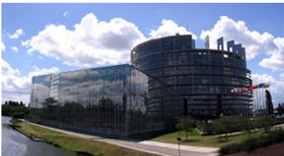
Zgrada Louise Weiss , sedište EP u Strazburu

Evropski parlament (EP) je jedina neposredno birana, parlamentarna institucija Evropske unije . Zajedno sa Savetom Evropske unije , on čini dvodomnu zakonodavnu granu institucija Unije i opisivan je kao jedno od najmoćnijih zakonodavnih tela na svetu. Parlament i Savet čine najviše zakonodavno telo unutar Unije. Međutim, njihove moći su ograničene na ovlašćenja koja su zemlje članice prenele na Evropsku zajednicu . Stoga Parlament ima malo uticaja na oblasti politike koje su zemlje članice zadržale, ili su unutar druga dva od tri stuba Evropske unije . Za razliku od većine nacionalnih parlamenata, Evropski parlament nema pravo zakonodavne inicijative , i iako je on „prva institucija“ Evropske unije (koja se prva navodi u Ugovorima i ima ceremonijalno prvenstvo nad svim moćima na evropskom nivou), Savet ima veće moći u oblastima zakonodavstva u kojima se ne primenjuje procedura koodlučivanja (sa jednakim pravima izmena i odbacivanja).