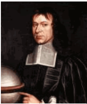
James Gregory (1638-1675)

Arhimed je izračunao \int_0^1 x^2 dx kao sumu geometrijskog reda.