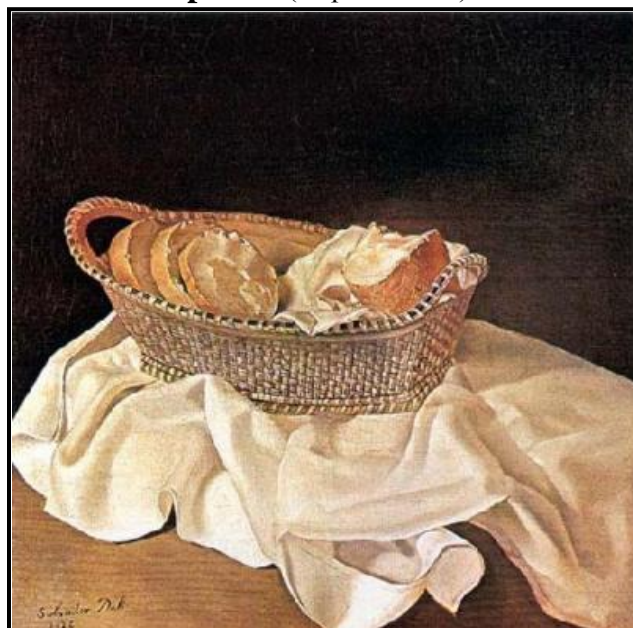
El cesto de pan (Корпа Хлеба) 1926

Будући да је поштовао све правце којих се дотакао, његов стил развијао се као варијација од академског класицизма до крајње авангарде, како у различитим делима, тако чак и комбиновано, у једном истом делу. Његове изложбе привукле су доста публицитета, док је критика била помешана. Знао је добијати и веома високе оцене понекад, а најчешће је добијао