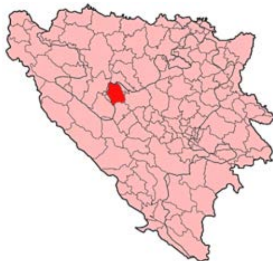
Položaj opštine Jajce na mapi BiH

Već u drugoj polovini 1943. godine većina svih naroda Jugoslavije bila je na strani Narodnooslobodilačkog pokreta. Svetska demokratska javnost sve je više davala podršku oslobodilačkom pokretu jugoslovenskih naroda. Prema "Quadrant" konferenciji u Kvebeku 24. 8. 1943. anglo - američki saveznički štab rešio je da snabdeva partizane oružjem i opremom i da pomaže akcijama komandosa i bombardovanjem strateških objekata. Uskoro dolazi do sve češćeg kontakta između zapadnih saveznika i Vrhovnog štaba u vezi s ratnim pitanjima, te Vrhovni štab dolazi u mogućnost da zahteva da se vrate ratni i trgovački brodovi koje je Italija zaplenila, da se krene sa isporukama savremenog naoružanja (tenkova, artiljerije, avijacije) itd. Iako su priznavali uspehe NOV i slali joj pomoć, zapadni saveznici nisu hteli promeniti svoju politiku prema izbegličkoj monarhističkoj vladi, oni su je i dalje smatrali legitimnim predstavnikom Jugoslavije.