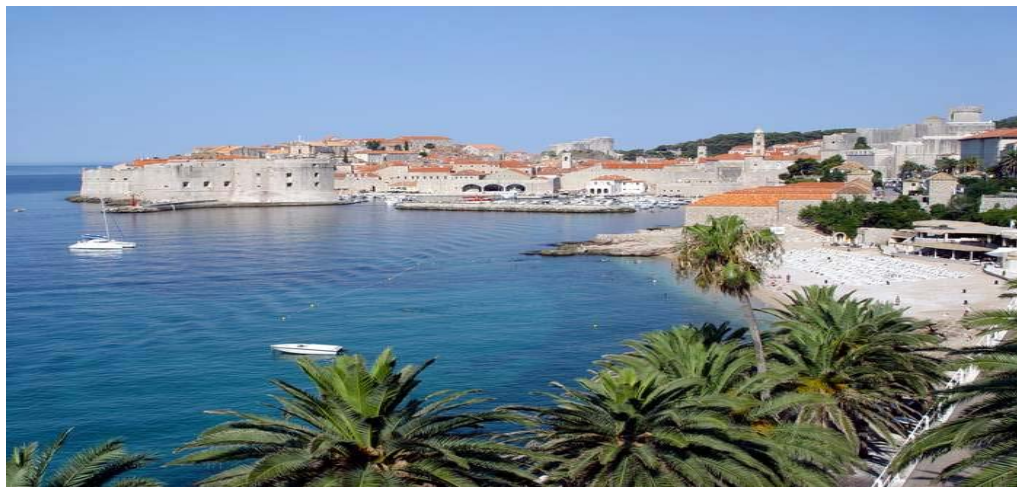
Slika 1. Dubrovnik

Dubrovnik, grad baroka i renesanse, grad velike istorijske i kulturne vrednosti, spada u jedan od evropskih kulturnih centara. Na njegov istorijski značaj se pridodaje i prirodna lepota koju poseduje, pre svega more, prostrane plaže i prijatna mediteranska klima. Još mnoge značajne elemente i mogućnosti nudi ovaj grad, zbog čega je svakako vredan pažnje. Sklop društvenih i prirodnih atraktivnosti učinio je ovaj grad značajnim turističkim mestom, koje svake godine poseti nekoliko stotina hiljada turista. Da je izgledom jedinstven može se zaključiti i pre ulaska u grad, jer sam pogled na grad - kontrasti boja kamenitih starih građevina, karakterističnih crvenih krovova i nebeskog i morskog plavetnila, nikako ne ostavlja turiste ravnodušnim. I ako površinski mali, nikako nije umanjena njegova jedinstvena istorijska veličina, utvrđena debelim, kamenim poveljom gradskih zidina. Uske ulice koje blistaju mramornim sjajem vremena, blizina revijere, preplavljene vinogradima i maslinjacima, dočaravaju dinamično – miran sklad prirode i čoveka.