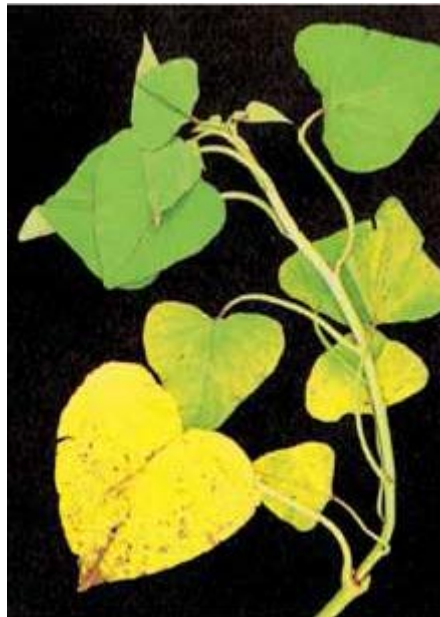
Slika br.1 Izgled biljke bez upotrebe đubriva

Osnova bioloških metoda za utvrđivanje potreba u djubrenju je korišćenje biljaka i mikroorganizama. Neke metode se baziraju na reakcijama biljaka i mikroorganizama na količinu biljnih hraniva, dok druge, uz ove, koriste i hemijska ispitivanja biljnih tkiva.