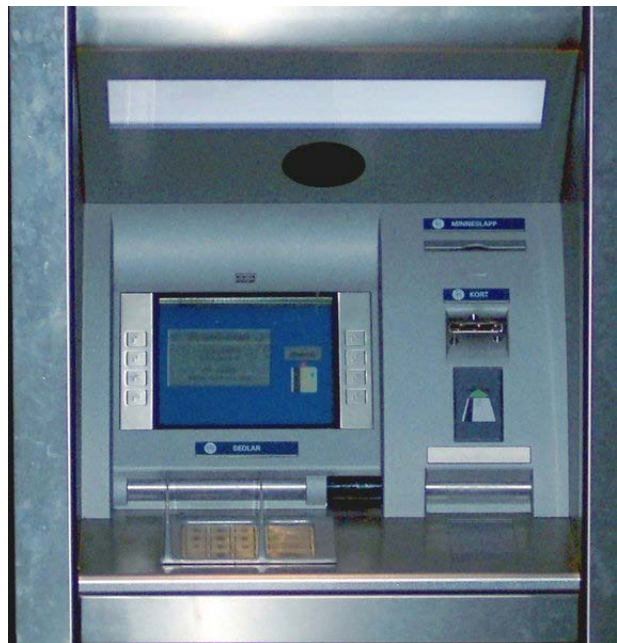
Slika 1. Izgled bankomata

Bankomati ili samouslužni šalteri, koriste se od strane banaka sa ciljem da povećaju kvalitet svojih usluga, orijentisanih prema klijentima, koje se uglavnom odnose na rutinske bankarske operacije. Bankomati nude vlasnicima platnih kartica sledeće usluge: podizanje gotovine (cash dispenser), polaganje depozita, transfer sredstava sa računa na račun, uplate na račune, naručivanje i primanje izveštaja. 1