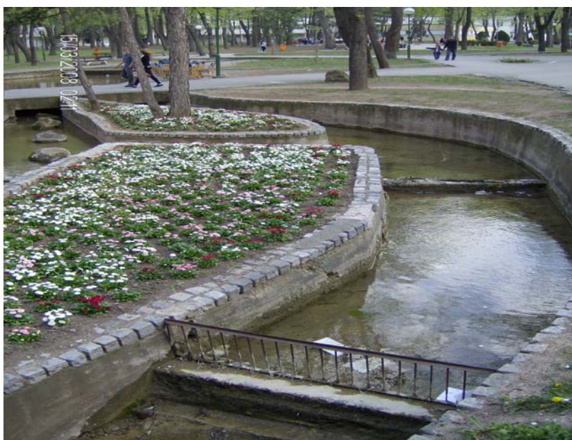
Sl.1.Proticanje termalne vode kroz Nisku banju

Isticanje vode iz izdanka, vrsti se u zoni isticanja na vise nacina. Najcesci oblik izbijanja vode na površinu je u vidu mlazeva, pa takve izvore nazivamo mlaznim ili pravim izvorom. Redji oblik izbijanja vode na površinu je difuzni u narodu poznat kao "pistevina" ili "pistoljina". Tada, podzemna voda moze mestimicno da izbije na površinu litosfere na vecoj površini, stvarajuci zamocvareno zemljiste. Osnovni uzrok stvaranja izvora je gravitaciona kretanja izdanskih voda, pa takve izvore nazivamo gravitacionim. Gravitacioni izvori se najcesce javljaju na mestima gde topografska površina preseca nepopustljivu podlogu izdanka. Na dodiru vodopropustljivih stena u povlati i vododrzljivih u podani pojavljuje se izvorski nizveci broj izvora rasporedjenih u nizu duz linije kojom topografka površina preseca pomenute stene. Kada je ta linija horizontalna ili blago nagnuta, tada niz izvora pokazuje polozej izvorskog horizonta.