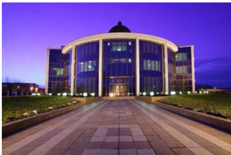
Velelepni objekat kompanije Swisslion

Proizvodni asortiman se bazira na zdravoj i obogaćenoj hrani, koji čine slatka i slana proizvodna linija. Asortiman proizvoda Swissliona je najveći u zemlji i regionu. Izvoz na inostrano tržište čini 40% ukupne proizvodnje. Zemlje uvoznice su pre svega zemlje bivše SFRJ, ali i evropske zemlje (Bugarska, Turska, Rumunija), a izvozi se čak i u Ameriku i Afriku.