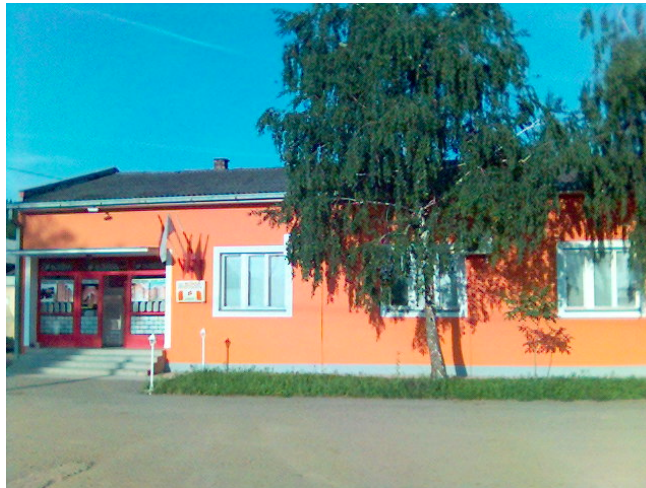
Slika 1.1. Upravna zgrada fabrike “Sloga” a.d.

Fabrika građevinske keramike “Sloga” a.d. nalazi se u Petrovaradinu na Bukovačkom putu 5. Osnovana je 1960. godine u istom obliku kao i danas po nemačkoj tehnologiji. Njena površina iznosi 352.484 m 2 . Pre osnivanja, na tom mestu se nalazila mala ciglana. Karakteristično je da ima dve peći tipa “Lingl” i dva para tunelskih sušara sa ukupno 16 kanala. Nije izgrađena u industrijskoj zoni, već u neposrednoj blizini (200-300 m) kvalitetne sirovine za proizvodnju svog asortimana, a takođe je u blizini velikog centra – Novog Sada, koji je veliki potrošač građevinske keramike poslednjih godina. Iz tog razloga su troškovi transporta niski u odnosu na cenu proizvoda za većinu kupaca. Obzirom da “Sloga” a.d. vrlo često u toku dana preradi i do 300 t sirovine (oko 12 šlepera) njena izgradnja u industrijskoj zoni ne bi bila isplativa.